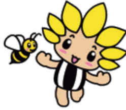
座間市マスコットキャラクター 「ざまりん」

発行/座間市 編集/総合政策部秘書広報課 〒252-8566 神奈川県座間市緑ヶ丘1-1-1 ☎046(255)1111(代表) (FAX)046(255)3550