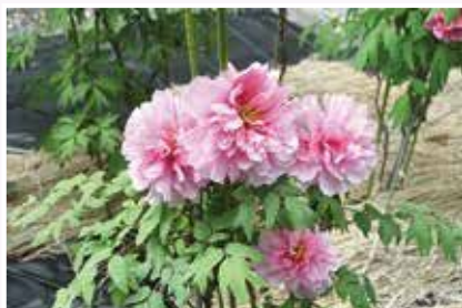
友好交流都市須賀川市寄贈のポタン