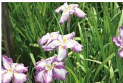
立野台公園のハナシヨウ