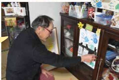
日めくりカレンダーで日付を確認するのが日課