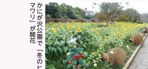
かみが沢公園で「冬のヒマワリ」が開花