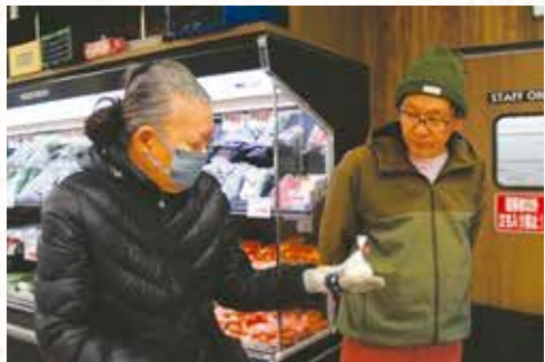
仕事が休みの日は2人で買い物に行きます

孫たちもスーパーで手をつないでくれたりして優しいし、毎日ビデオ通話をしてくれたり協力的でよく理解してくれています。周りの協力があるから笑って過ごせるし、イライラしたこともありません。夫に対しては言葉を無視したり否定したりすることはしないように心掛けています。