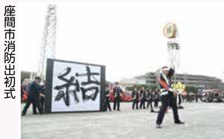
座間市消防出初式