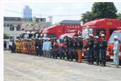
座間市総合防災訓練