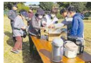
防災訓練での炊き出し準備

昭和40年代前半(1960年代後半)に造成・入居が始まった緑ヶ丘2丁目の地域で、自治会活動は57年目に入りました。第一次の入居者世代から次の世代や新規転入者へと世代交代しつつあります。令和5年度に集会所の大規模改修が完成しました。20年、30年先を見据えて、会員・住民のみなさんが安心して暮らせるように、防犯・防災を視野に入れながら活動し、同時に文化的な活動をも支援する形で鋭意努めています。