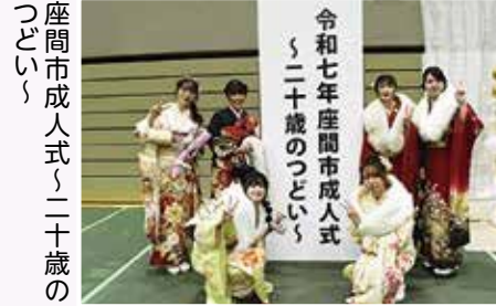
座間市成人式〜二十歳のつどい〜

担当 秘書広報課 ☎046(252)8321 (FAX)046(255)5090