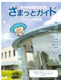
2024年度版ざまっとガイド

担当 市民協働課 ☎046(252)7966 (FAX)046(255)3550