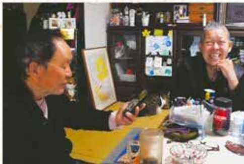
お孫さんとのビデオ通話が楽しみ