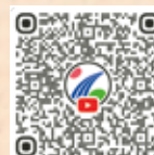
市公式チャンネル