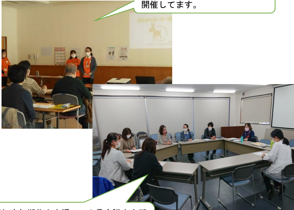
認知症サポーター養成講座を開催しています。

保健衛生主管課に所属する保健師や管理栄養士は、介護予防事業主管課と連携しながら、市内6か所の地域包括支援センター職員と顔の見える関係づくりに努めています。