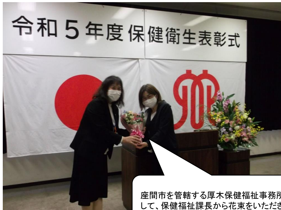
座間市を管轄する厚木保健福祉事務所を代表して、保健福祉課長から花束をいただきました。

神奈川県厚木保健福祉事務所では毎年、多年にわたり公衆衛生の向上に尽力された功績を広く管内県民に顕彰することを目的に保健衛生表彰を行っています。