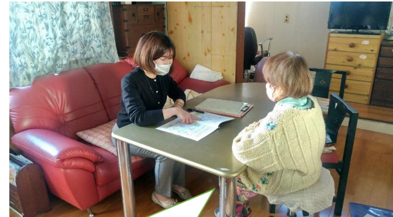
市内を縦横無尽に公用車で奔走。 対象となる市民の御自宅へ訪問させていただいています。

令和5年度は、フレイル対策をキーワードに、保健衛生主管課の保健師と本事業の所管課である保険年金課の管理栄養士が連携し、対象となる市民宅へ訪問し、保健指導を実施しています。