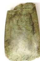
磨製石斧 (マセイセキフ)