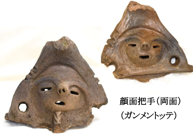
顔面把手(両面) (ガンメントツテ)