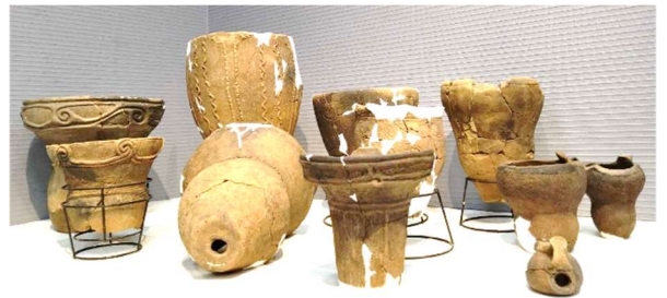
注口土器(チュウコウドキ)