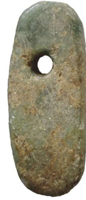
ヒスイの太珠 (ヒスイノタイシュ)