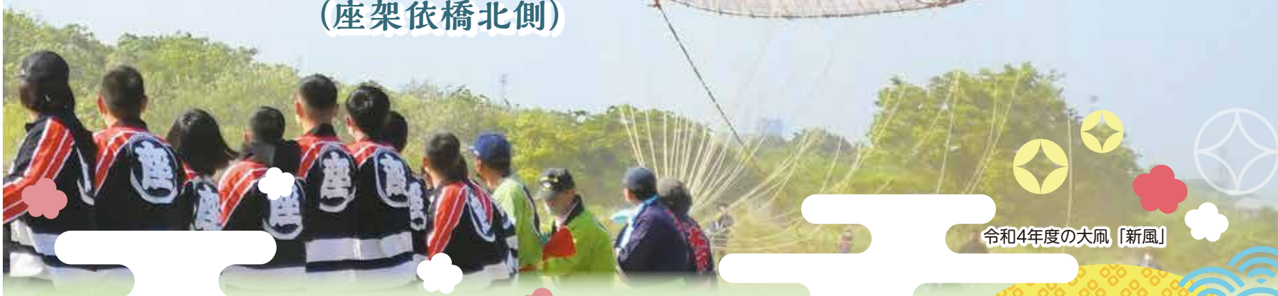
令和4年度の大凧「新風」

「座間市大凧まつり」を4年ぶりに通常開催します。 大凧まつりでは、百畳敷き(13メートル四方)、重さ 約1トンの大凧を、座間市大凧保存会を中心とした約 100人が力を合わせて綱を引き、大空へ掲揚します。