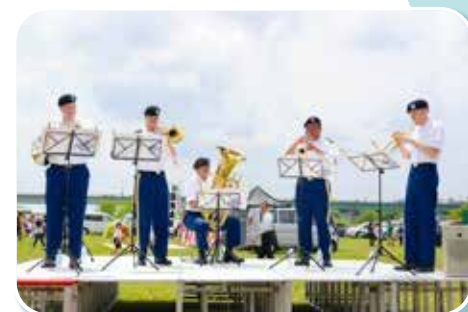
軍楽隊による演奏