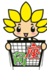
座間市マスコットキャラクター 「ざまりん」

座間市大凧まつりを 4年ぶりに 通常開催します。 大空に掲揚する大凧を ご覧ください。