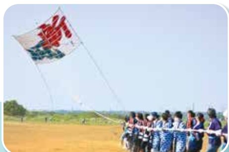
令和4年度の大凧「新風」