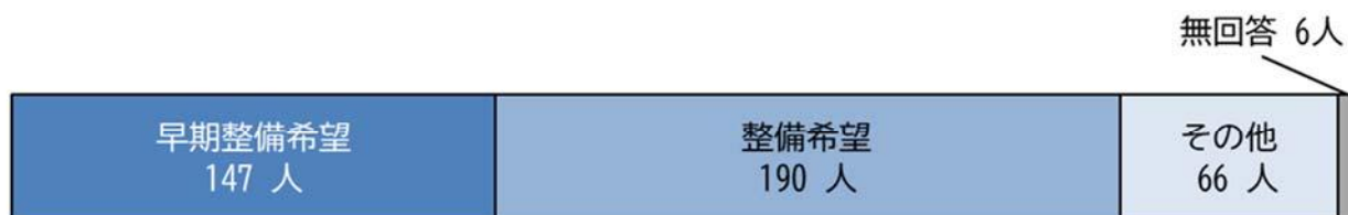
図2 下水道整備についてのアンケート結果

本市では、「座間市汚水処理施設整備構想（アクションプラン）」の策定に当たり、対象区域にお住まいの方に対してアンケート（令和元年9月）及び説明会（令和2年度）を実施しました。下水道整備についてのアンケートでは、83%（全回答数409名）の方が下水道の整備を希望との結果でした。アンケートの結果を以下に示します。