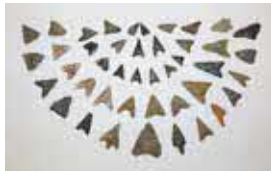
石鏝 (市内間の原遺跡出土)

担当 生涯学習課 ☎046(252)8431 (FAX)046(252)4311