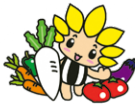
座間市マスコットキャラクター「ざまりん」

発行/座間市 編集/市長室市政戦略課 〒252-8566 神奈川県座間市緑ヶ丘1-1-1 ☎046(255)1111(代表) FAX046(255)3550