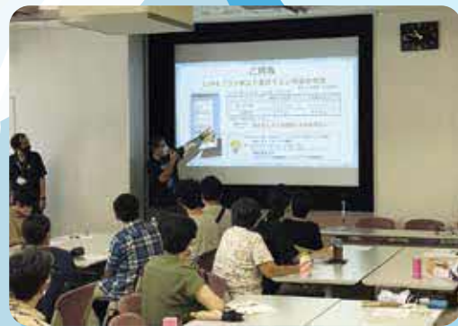
中間交流会の様子