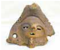
両面顔面把手 (市内蟹ヶ澤遺跡出土)