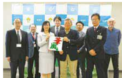
凧文字「華風」を持つ市長(左)と凧文字選考委員長(右)

担当 市大凧まつり実行委員会事務局(商工観光課内) ☎046(252)7604 (FAX)046(255)3550