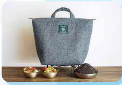
バッグ型コンポスト