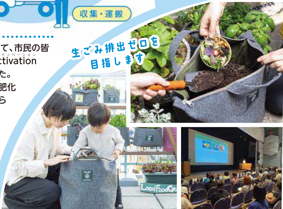
生ごみを堆肥化する「バッグ型コンポスト」