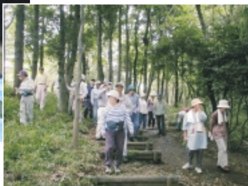
自然観察会も開かれます