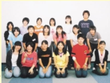
スマーナを夢見て研修に取り組みました

担当 市国際交流協会事務局(渉外課内) ☎046(252)8307 ☎046(255)3550