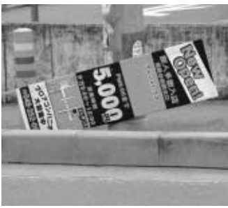
倒れた立て看板は、さらに危険です

道路管理者から道路占用許可を受けなければなりません。また、電柱やガードレール、植樹帯などに張られた看板や張り札は、針金などが通行する人の顔に当たると大変危険です。こうした広告物は県の条例によ