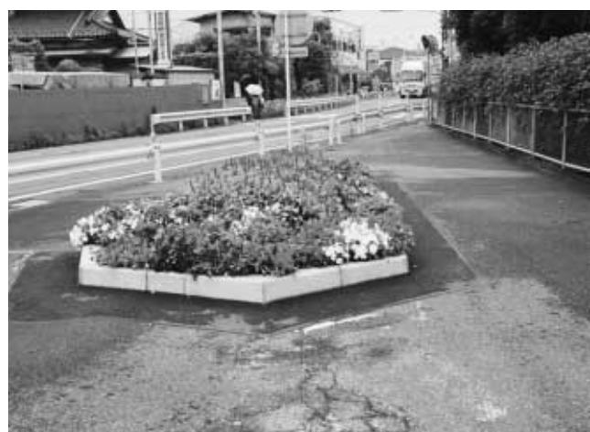
さまざまな花が道路を彩ります

市では、平成十三年度から「花いっぱい運動事業」として、市道の沿線六百三十一カ所に、季節の花を植えたプランターを設置しました。地域の皆さんにご協力をいただき、季節の移り変わりを告げる花を植えることで、わたしたちの暮らし