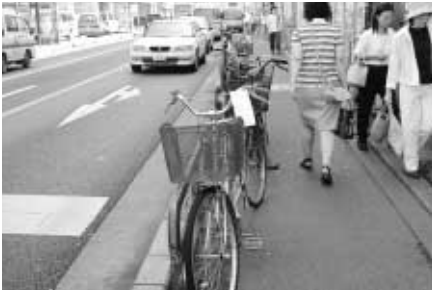
通行する人にとって大変危険な迷惑駐輪

駐輪してはいけない場所に止められた自転車やバイク、道路に投げ捨てられた空き缶やたばこの吸殻などによって、不快に感じられたことはありませんか?決められた場所以外での駐輪やごみの投げ捨ては禁止されています。一人一人の心掛け