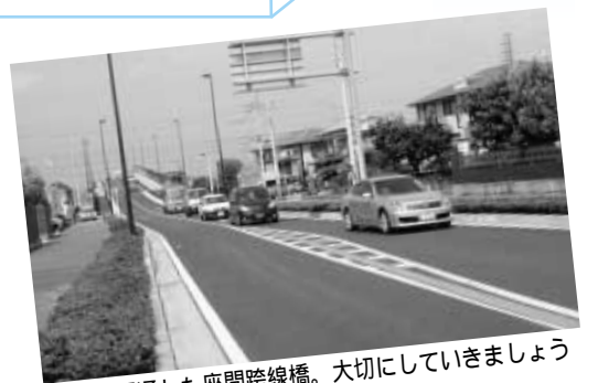
6月に開通した座間跨線橋。大切にしていきたいと思います。

わたしたちの毎日の生活に欠かすことのできない公共施設「道路」。学校に行く道、職場に行く道、買い物に行く道など、一歩家の外に出れば道路を利用しない日はありません。