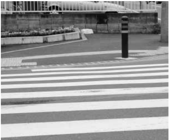
視覚障害者誘導用ブロックの設置や段差の解消策が施された歩道

市では、高齢者や身体障害者などが移動する際に、身体負担を軽減し、移動の利便性と安全性を向上させるため、歩行空間のバリアフリー(体の不自由な人も障害がなく活動できるような生活環境)化を進めています。だれもが安心して通行できるようにと、歩道などの有効幅員の確保、歩道の段差解消、バス停留