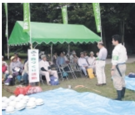
作業の前には十分な説明を