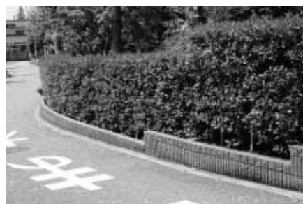
きれいに手入れされた生け垣で快適な道路に

良好な居住環境をつくる生け垣などの果たす役割や重要性は大きく、市でも生け垣設置に対する奨励金の制度を設けるなど、市民の皆さんに積極的に生け垣を設置するよう呼び掛けています。しかし、良好な環境のための生け垣も、道路に大きく張り出してしまつて