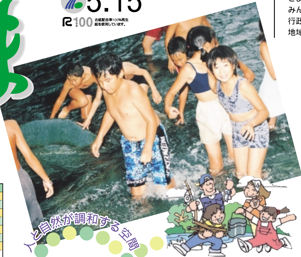
人と自然が調和する空間

ざまインフォメーション(2面) みんなの健康(3面) 行政相談強調週間(4面) 地域福祉シンポジウム(4面)