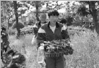
みなみちゅうがっこう ねんせい ▲南 中学校2年生