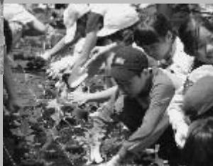
ひがしはらしやうがっこう ねんせい 東原小学校6年生▶