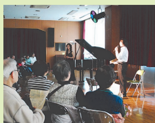
同センターホールでのコンサートの様子

画し実施しています。その中心になる事業が十月二十三日から開催される「文化祭」です。例年、文化祭ではサークルが日ごろの活動を展示発表したり模擬店を出店したりして、利用者ばかりでなく来館者も交えサークル談義に花を咲かせる交流のよい機会になっています。特に今年度は日程を拡大して、より多くの来館者が楽しめるような企画になりました。公民館活動をテ