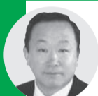
伊藤 正 議員《新政いさま》