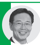
上沢 本尚 議員《公明党》