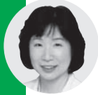
安田 早苗 議員《公明党》