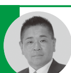
熊切 和人 議員《自民党・いさま》

拠について伺います。 福祉部長 14日以内と記載 することについては、しおり の見直しとあわせて検討して いきます。また、振り仮名に ついては、今後検討してい ます。誓約書の記載について は、制度に対する理解を進め るため記載していますが、法 的根拠はありません。