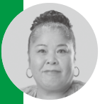
星野 久美子 議員《日本共産党》

健康部長 介護予防・日常 生活支援総合事業のサービ スの現状は、要支援1の558 人のうち40人、要支援2の7 17人のうち81人が既に総合 事業に移行済みです。課題に ついては、慎重に検討しなが ら有益なサービスにつなげて いきたいと考えています。