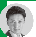
高波 貴志 議員《自民党・いさま》