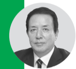
伊田 雅彦 議員《自民党・いさま》

座間のひまわりまつりは、今年から栗原会場での開催がなくなり、座間会場に一本化されます。ひまわりまつりの絶大な人気から考えても、座間会場に一本化されることによる交通渋滞について、会場近隣にお住まいの方々だけでなく、会場へ通じる主要な道路の沿線にお住まいの方々も、大変心配されていることとされています。座間会場に一本化されることにより、座間1丁目、2丁目、新田宿、四ツ谷、そして入谷1丁目、2丁目付近まで、大きな渋滞が発生する可能性もあります。