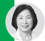
安田 早苗 議員《公明党》

本市の学校給食費は、学校が独自に管理する私会計方式を採用していますが、未納者対応における教員の心理的負担は小さくありません。文部科学省は、学校における働き方改革の提言の中で、私会計制度を改め、公会計化を求めています。公会計化を導入すると、学校での現金納入に児童や保護者を介さないため個人情報を守られ、また、会計が監査の対象となることで、より透明化され、安全に管理ができます。給食費未納の対応についても、就学援助制度の活用だけでなく、保護者の申し出があれば児童手当からの徴収も可能となり、不足金