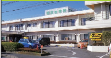
人工透析/各種健診(健康診断・乳がん検診)