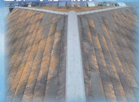
屋根工事施工後例