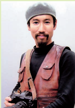
戦場カメラマン 渡部陽一さん

○申込方法 往復はがき往信用裏面に「記念式典入場券申し込み」と記入して住所・氏名・電話番号・申込人数(はがき1枚につき4人まで)を、返信用表面に受取人の郵便番号・住所・氏名を記入の上、7月31日(火)までに〒252-8566座間市緑ヶ丘1-1-1座間市役所広報広聴人権課へ郵送