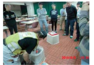
非常時の家庭用トイレ使用法説明

6月9日に東建座間ハイツで地区自連主催防災セミナーを行いました。米を入れた非常用炊出袋への注水時、手に水がかかりとっさに冷たいと声を出し、『漏斗』を使うといいとアドバイスしてもらいました。非常時の家庭用トイレの使用法や家具の固定の仕方、ガラス飛散防止なども体験学習し、講座での東日本大震災の映像に改めて皆が息を飲みました。お昼は炊き上がったご飯でおにぎりを作り味噌汁と一緒に美味しく頂きました。