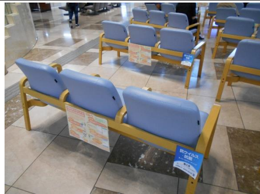
抗ウイルス・抗菌コーティング施工後