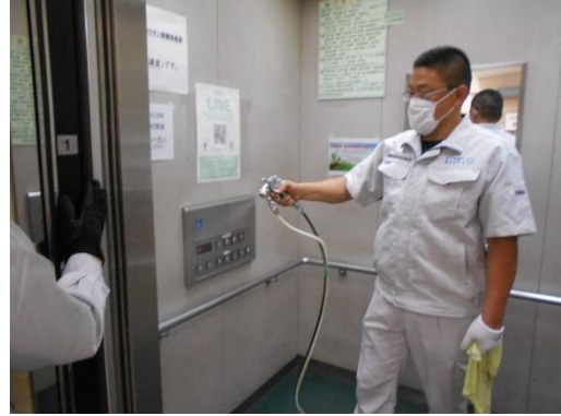
抗ウイルス・抗菌コーティング施工の様子