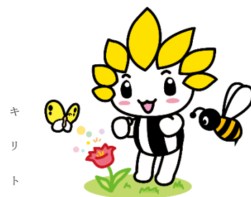
座間市マスコットキャラクター「ざまりん」